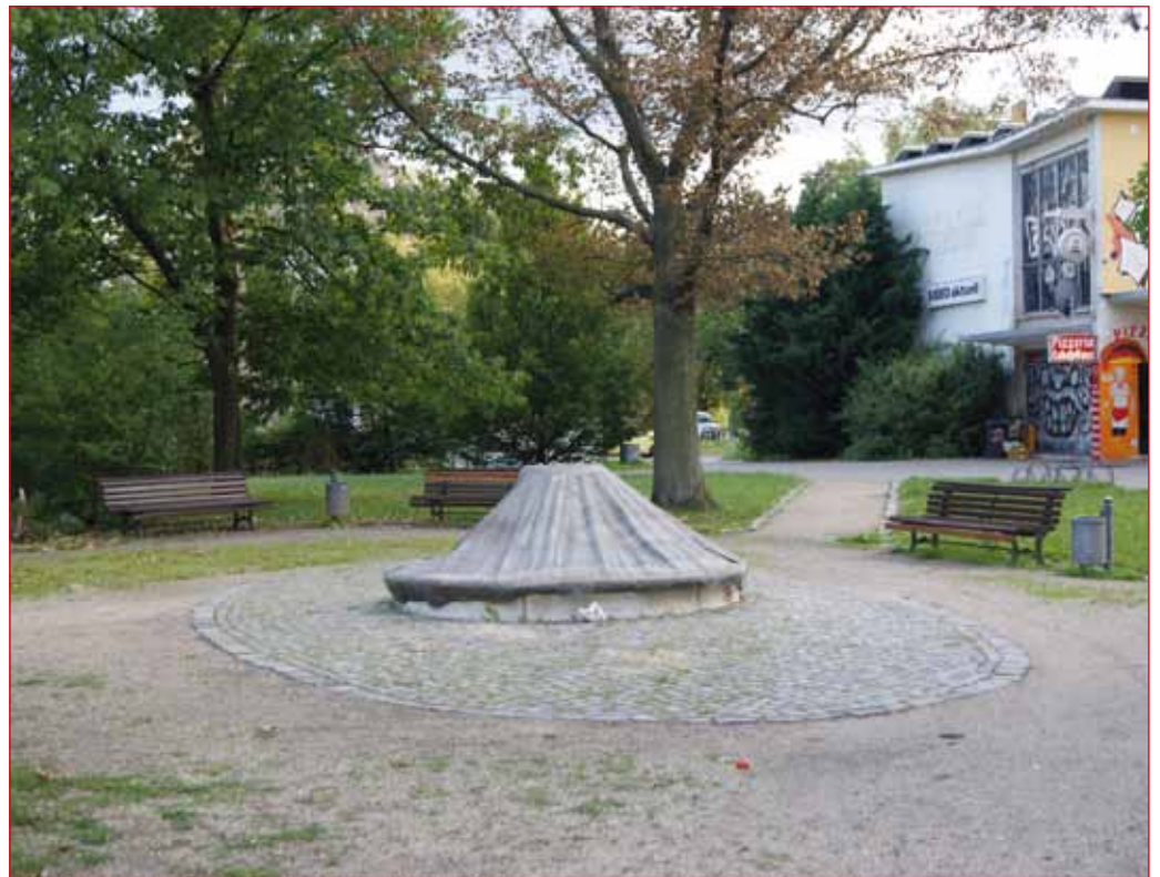
So wie hier, am Hochhaus in der Brielower Straße, sieht es an vielen Stellen im Brandenburger Stadtteil Nord aus.

Prekäre Beschäftigung und Leiharbeit sind an der Tagesordnung. Das soll die Zukunft sein? Städtische Unternehmen bzw. Unternehmen mit städtischer Beteiligung zahlen sittenwidrige Löhne! Und Gewerkschaften scheint unsere Oberbürgermeisterin zu meiden. An der 1. Mai-Kundgebung hat Frau