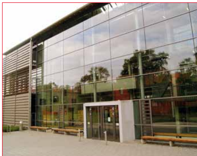
Das Amtsgericht Brandenburg an der Havel in der Magdeburger Straße